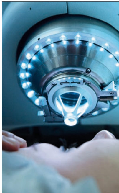
Abb. 1: Applikator bei der IntraLase Femtosekunden-Laser-Anwendung für die Femto-LASIK

Der wesentliche methodische Unterschied zwischen klassischer und Laser-Technik ist der Umstand, dass bei der Fs-Laser-Anwendung die gesamte Hornhaut applaniert wird und der Laserprozess optisch präzise gesteuert werden kann. Bei der klassischen mechanischen Methode hingegen entsteht Friktion durch die über die Hornhaut geführte Fortbewegung des Abstandshalters des Mikrokeratomkopfes. Je nach Hysterese der behandelten Hornhaut baut sich eine Gewebewelle vor dem Keratomkopf auf. Im Extremfall entsteht eine zentrale Knopflochperforation (button hole). Nicht selten - bis zu zehn Prozent - kommt es außerdem zu Verletzungen der epithelialen Basalmembran mit partiellen Epi-